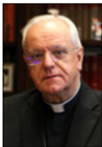
Mons. Lemos Montanet Bispo de Ourense