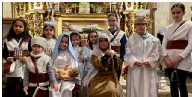
Belén da parroquia de Ribadavia: