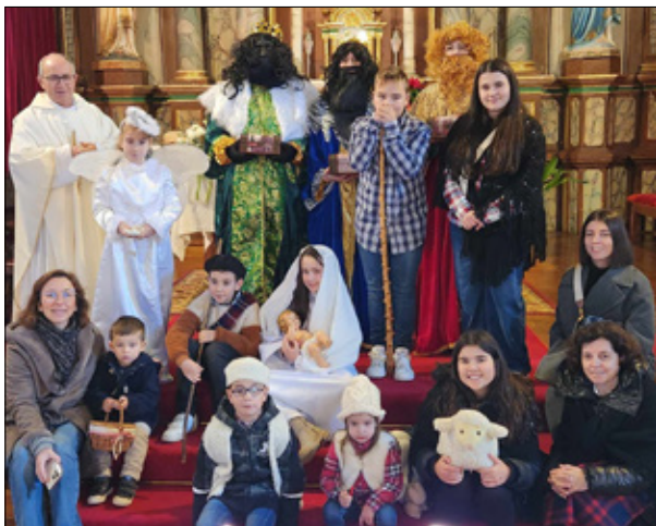
Nacimiento Viviente en Bande representado por los niños de Catecismo el día de Navidad: