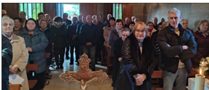
Fiesta Santa Lucía en Meizo (Macendo)