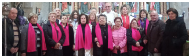
Celebracion de S. Martiño en Sagra cunha fermosa ofrenda floral e coa participación do coro de Sagra.