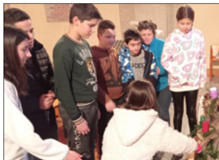
Los niños de Padren-da inauguraron el Adviento rezando por la paz.