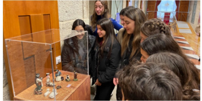
Exposición de Belenes 2022

Durante este adviento, contaremos con el calendario de adviento de la infancia misionera en el cual iremos día a día llevando a cabo una pequeña acción por las misiones e intentaremos conocer más acerca de la misión. Si estás interesado en tener uno, háznoslo saber para enviártelo.