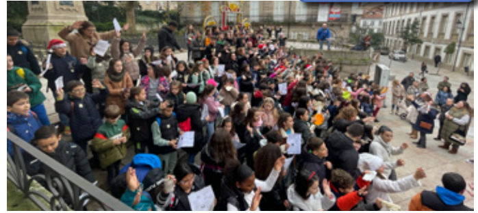
Sementadores Estrelas 2022

En relación con los 17 años que duró la cruel dictadura de Pinochet, asumió, en sintonía con la iglesia chilena, un compromiso firme de defensa y protección de la gente y los perseguidos, lo que llegó a poner en riesgo su vida, por lo que debió salir un tiempo del país.