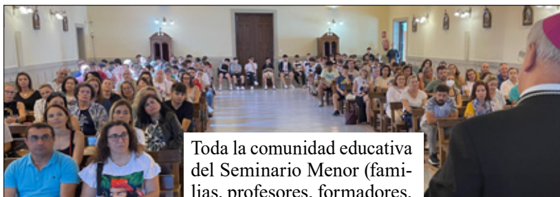
Toda la comunidad educativa del Seminario Menor (familias, profesores, formadores,

alumnos y personal de la casa) aprovechó el comienzo de curso para encontrarse y conocer el proyecto educativo y formativo, acompañados por el Sr. Obispo.