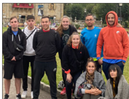
Fiesta organizada por los residentes del Centro de Discapacidad Nuestra Señora de Los Milagros:

En septiembre se celebraron en la Diócesis novenas en honor a la Santísima Virgen bajo distintas advocaciones. Desde el santuario de Los Milagros, Los Remedios en Ourense y en Vilamaior, el Cristal, el Portal en Ribadavia, la Armada, la romería da Nosa Señora da Aparecida en Porqueirós y el santuario de A Clamadoira nos llegaron las siguientes fotos.