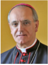
Mons. Lemos Montanet Bispo de Ourense