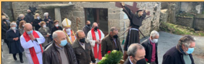
Fiesta de San Francisco Blanco en O Tameirón

Carta del Papa: Con ocasión de la Visita Ad Limina es costumbre que los Obispos, en nombre de la Iglesia diocesana, entreguen, en la medida de sus posibilidades, un donativo al Santo Padre para sus obras de apostolado y caridad. A este gesto respondió el Papa Francisco con una breve carta de agradecimiento dirigida al Obispo de Ourense, acompañada de un icono de San José.