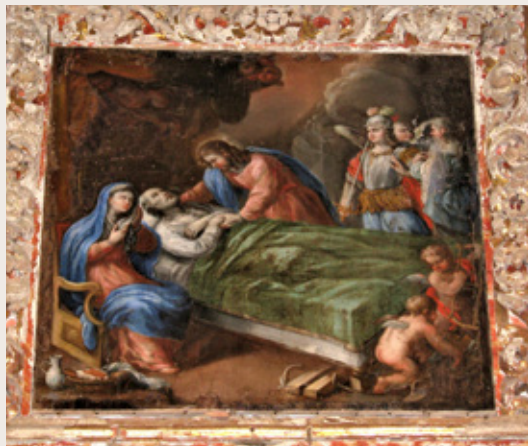
Iglesia de Santa María de Melón. Muerte de San José. Óleo siglo XVIII de muy curiosa iconografía.