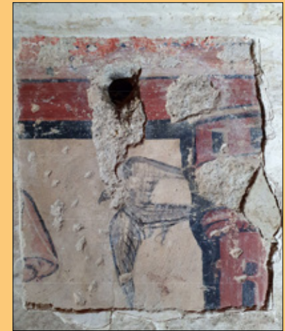
Un pájaro y la delimitación de la escena imitando una arquitectura