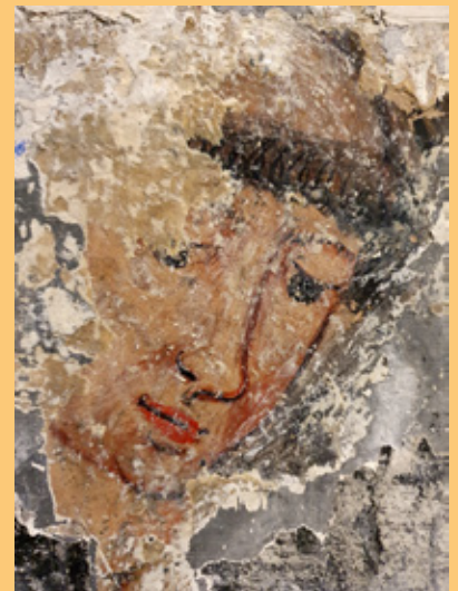
Rostró que posiblemente represente a un fraile.

El Centro de Conservación y Restauración San Martín ha elaborado un proyecto de conservación y restauración de dichas pinturas que la Delegación Episcopal de Patrimonio acaba de presentar a la Dirección Xeral de Patrimonio con el fin de recuperar para el ya rico patrimonio religioso-cultural de nuestra Diócesis esta obra inédita que podría ser de gran interés. Una vez recibido el permiso de la Xunta faltaría solo encontrar un donante preocupado por la conservación de nuestra historia que se ofreciese a sufragar los gastos.