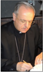
Monseñor Lemos Montanet Bispo de Ourense