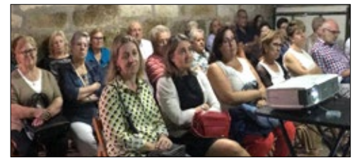
Nas fotografías a celebración de inicio da segunda etapa dos traballos Sinodais na Catedral e a presentación do Instrumento 3º en Ribadavia e a Limia.

derados" para traballar en equipo, asumir responsabilidades e participar nas decisións importantes.