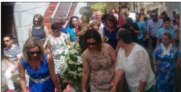
A parroquia de San Salvador de Faramontaos celebrou a festa do seu patrón e a Virxe das Neves.