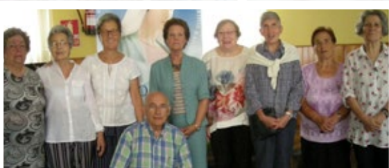
Los voluntarios también retransmitieron el Rosario desde la parroquia de San Pío X.