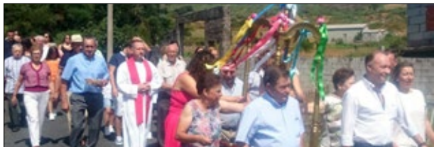
Festa de San Bartolomé da Fraga-Lobeira