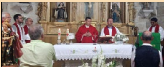
Sta. Cristina de Montelongo: romería con gran concurrencia de fieis e dos cregos da Baixa Limia.