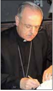
Monseñor Lemos Montanet Bispo de Ourense

A pocos días del comienzo del verano, cuando las circunstancias climatológicas comenzaban a ser más benignas, grupos numerosos de inmigrantes, procedentes de 31 países, la mayoría africanos, de Sudán, Argelia, Eritrea y Nigeria, con una representación minoritaria de países asiáticos como Afganistán y Pakistán, se hicieron presentes en el antiguo Mare Nostrum ¡resulta curioso el nombre antiguo del Mar Mediterráneo!