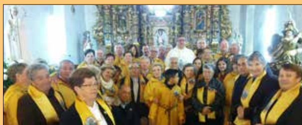
La parroquia de A Piteira rindió homenaje a su patrón, San Miguel, y a la Virgen de Fátima