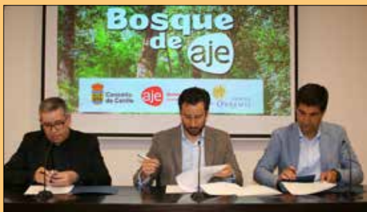
El Delegado episcopal de Economía, el presidente de AJE y el alcalde de Cenlle en el momento de la firma.

Por su parte, el Ayuntamiento de Cenlle se compromete a mantener cuidada la zona durante tres años, realizando un seguimiento de los árboles plantados para que enraícen bien. Además, contará con un espacio para el disfrute de vecinos y turistas, respaldando una iniciativa en favor del medio natural, las especies autóctonas y el espíritu emprendedor.