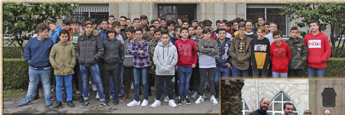
Seminario Menor A Inmaculada