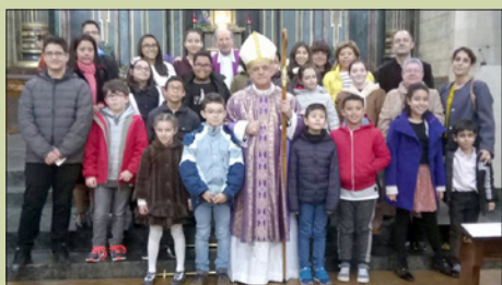
Santa Eufemia del Centro

En la parroquia de Celanova , los niños de catequesis celebraron el Día de la Paz elaborando, en un panel con los siete colores, el "arco iris de la paz".