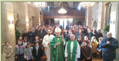
San Breixo de Seixalbo

El Sr. Obispo continuó la Visita Pastoral a parroquias del Arcipresbiterato Ourense Sur, a finales de enero y durante el mes de febrero. También realizó la Visita a la Catedral.