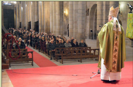
S.I. Catedral de Ourense