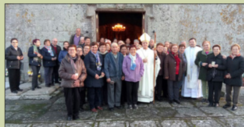
San Cibrao de Lamamá