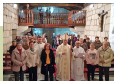
San Juan de Vide de Baños