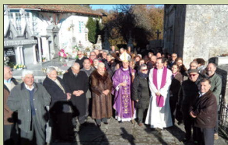
Santiago de Zorelle