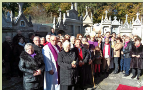
San Pedro de Maus-Porto