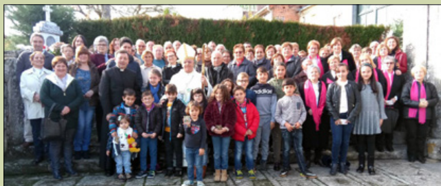
Santa María de Arnuide