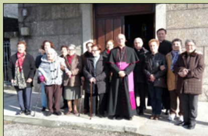
Santa María de Foncuberta

El Sr. Obispo continuó la Visita Pastoral en las parroquias administradas por los PP. Paúles de Os Milagros.