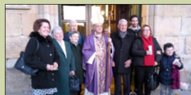
Santuario de Os Milagros