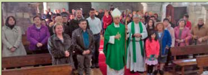
San Salvador de Loña do Monte

El Sr. Obispo continuó la Visita Pastoral en la zona de Castro Caldelas y Maceda.