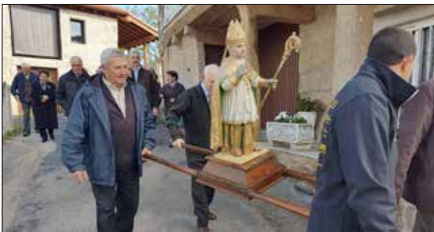
Fiesta de San Martiño de Moreiras .