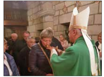
Celebración en el Santuario de Ntra. Sra. de Os Gozos , donde se veneró una reliquia de San Juan Pablo II.