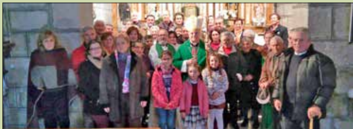
San Esteban de Ambía