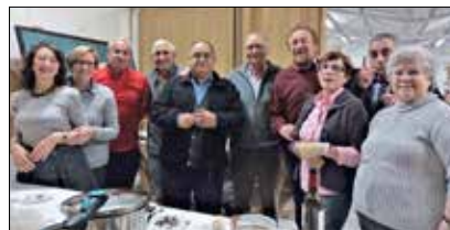
Ntra. Sra. de Fátima .