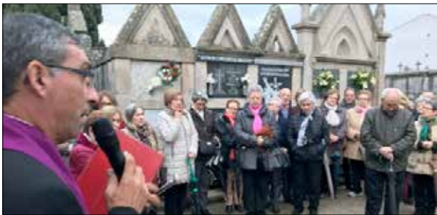
Fieles Difuntos y Todos los Santos en Xinzo .

Durante el mes de noviembre son muchas las parroquias que celebran su magosto :