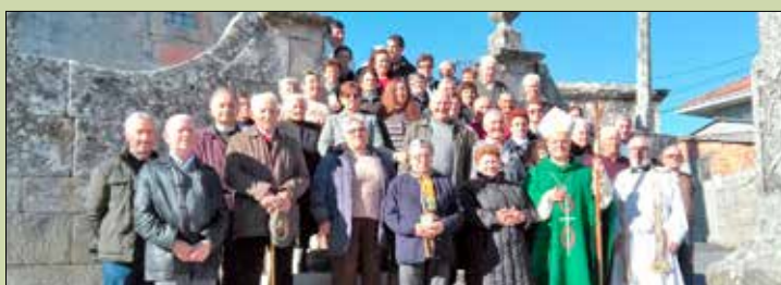
Santa María de Almoite