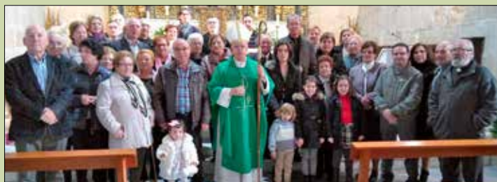
San Salvador de Baños de Molgas