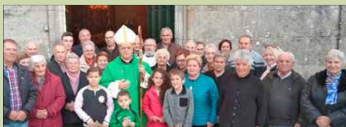
Santa María de Guamil