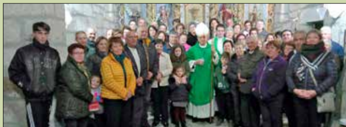
Santa Eulalia de Esgos