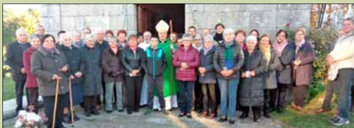
San Martiño de Presqueira