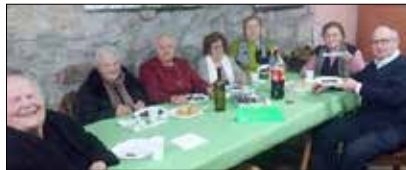
San Pedro de Bande .