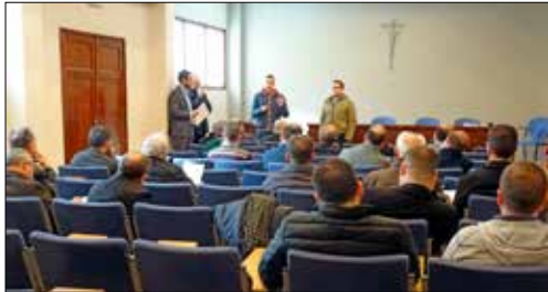
La Asamblea de Arciprestes, Vicearciprestes y Delegados, dedicó un tiempo de su encuentro a revisar la marcha de los grupos sinodales.

Con estas palabras alentaba el profeta Isaías a los deportados y les anunciaba un tiempo nuevo. El Adviento, que inauguramos, es un tiempo de esperanza. Con la Iglesia, clamamos al cielo: Ven a visitar tu viña (Sal 79) y nos disponemos a acoger al Emmanuel preparando nuestros corazones y nuestra Iglesia para convertirnos y abrir los caminos que permiten que Dios llegue al corazón de cada persona.