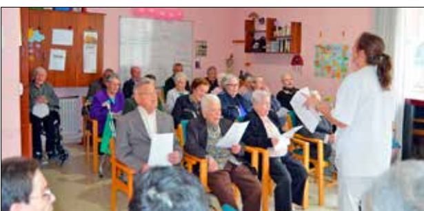
Eucaristía y fiesta celebrando a San Carlos en la residencia del mismo nombre en Celanova.