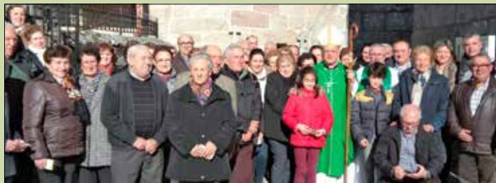
San Martiño de Nogueira de Betán