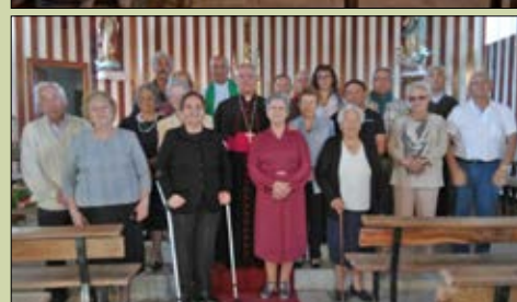
San Pedro Fiz de Sas de Penelas y