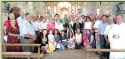
Santa María de Mazaira