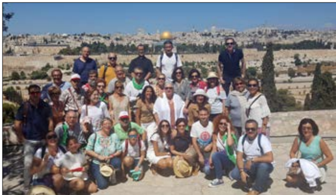
La parroquia de San Pío X de Ourense peregrinó a Tierra Santa del 23 al 31 de julio, visitando lugares emblemáticos de la vida de Jesús.