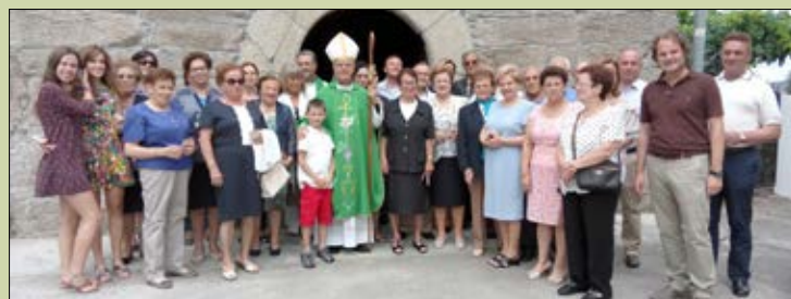
Santa Catalina de A Teixeira