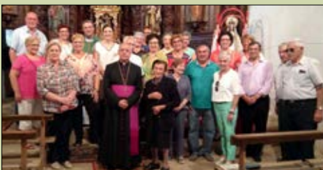
Santa Tecla de Abeleda