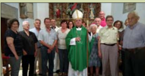
Santa Marina de Montoedo