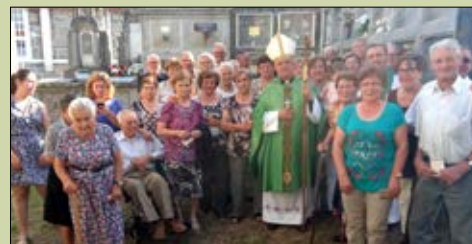
Santa María de Boazo