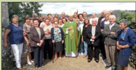
San Salvador de Cristosende