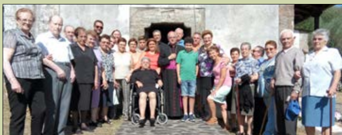
San Vicente de Paradela