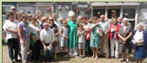
San Martín de Piedrafita