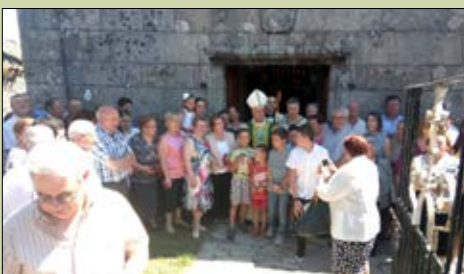
San Mamede de Pedrouzos,