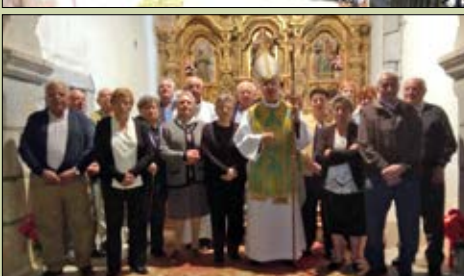
Santa Eulalia de Trabazos,