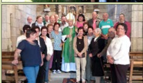
San Pedro de Alais,