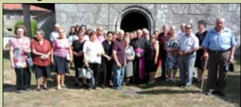
San Juan de Poboeiros