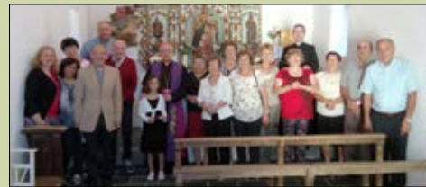
Santa María de Castrelo