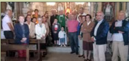
San Juan de Seoane