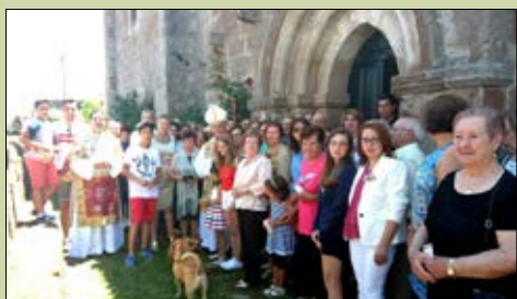
Santa María de Burgo de Candelas,