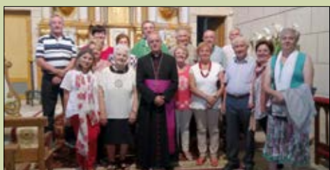
Santa María de Abeleda