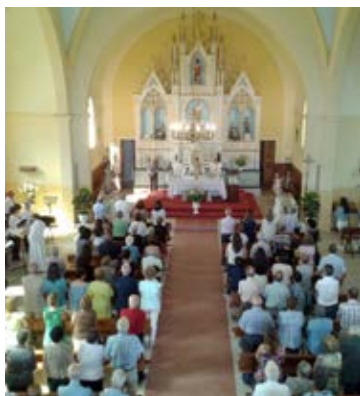
En Sta. M a de Tamallancos celebraron la Virgen de la Asunción y el San Roque