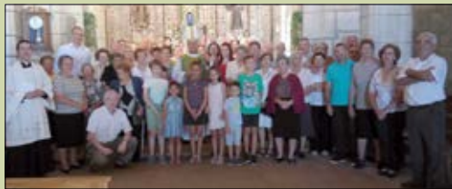
Santiago de Tronceda

El Sr. Obispo continuó su Visita Pastoral en la zona de Caldelas.