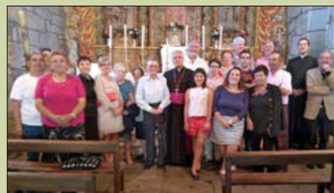
Santiago de Medorra,