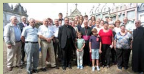
Santa María de Sistín