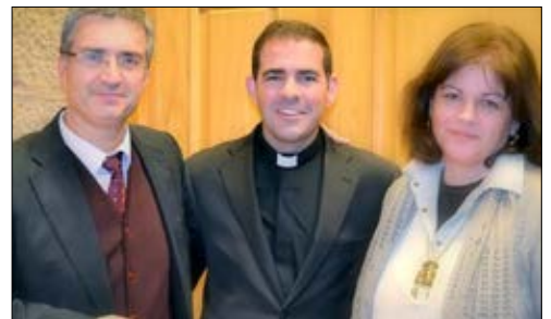
El director y la coordinadora pedagógica del Instituto da Familia acompañados del director del Seminario Menor y Mayor de Astorga (en el centro).

El Instituto da Familia nació con vocación de servicio a las familias de Ourense. Pero poco a poco, a medida en que va siendo conocida fuera, va teniendo presencia con actividades en otras provincias. En los próximos meses, ofrecerá cursos para matrimonios y familias en Vitoria y Madrid. Pero ahora mismo, está en marcha el Curso de Formación en Inteligencia emocional y formación del carácter que se imparte en el Seminario de Astorga para todos los seminaristas del Seminario menor. Se trata de un curso que dura todo el año, en el que se van ofreciendo a adolescentes formación teórica y talleres prácticos para mejorar su inteligencia emocional, su autoconocimiento, la adquisición de virtudes así como para realizar y acompañar un proyecto de vida. Quien quiera conocer las iniciativas y ofertas del Instituto da Familia puede hacerlo a través de la página web www.institutodafamilia.es