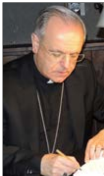
Monseñor Lemos Montanet Bispo de Ourense

Te escribo estas legtras teniendo ante mi el misterio de la Natividad del Señor: es un retablo vivo que nos interpela a todos para que seamos mejores, de manera especial para que, imitando al Dios hecho hombre, luchemos por convertirnos en constructores de Paz.