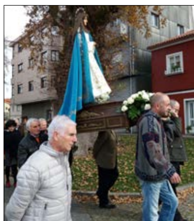
Procesión de la Inmaculada en Bande: María es para nosotros el ejemplo de espera y esperanza a lo largo del Tiempo de Adviento.

En algunas zonas, como es el caso de Celanova , desde hace varios años se celebra también la bendición de las imágenes del Niño Jesús, igual que en la Catedral. En la Eucaristía de la Misa con niños, tuvo lugar en el templo de San Rosendo de Celanova esta celebración en la que participaron muchos fieles. También se bendijo el nacimiento colocado bajo el techo del coro alto, ocupando una extensión muy grande. Lo preparan hombres de la parroquia que le dedican tiempo y afición y son muchos los visitantes que se detienen ante él.