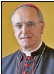
Monseñor Lemos Montanet Bispo de Ourense