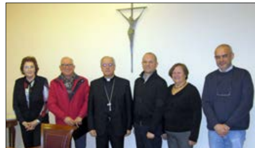
En marzo el señor Obispo recibió a la Junta Directiva de la Sociedad de San Vicente de Paul, para hacerle entrega de la memoria anual del año 2015.

El viernes 4 de marzo los 550 alumnos del colegio M a Inmaculada de Verín, desde Educación Infantil hasta 4 o de Secundaria, celebraron en la Parroquia de Verín la Jornada del Jubileo de la Misericordia, acto organizado por el grupo de sacerdotes de la UAP, en colaboración con el departamento de Pastoral de dicho centro, que estuvo presidida por el Sr. Obispo.