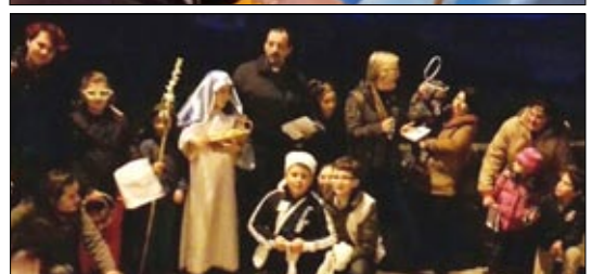
Feligreses de Queiroas, San Mamede y Sta Baia de Urrós visitaron a los enfermos en Navidad.

Residencia de Nosa Señora dos Anxos de Ribadavia