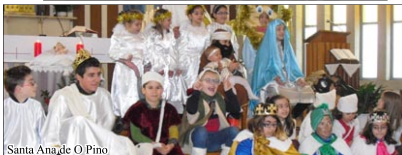
Santa Ana de O Pino