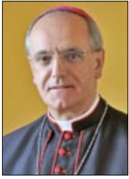
Monseñor Lemos Montanet Bispo de Ourense