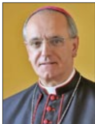
Monseñor Lemos Montanet Bispo de Ourense