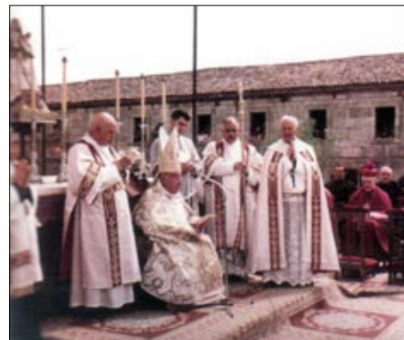
Coronación de la Virgen de Los Milagros, 6-9-1964. En el centro, el Cardenal Quiroga.

Además de las peregrinaciones de las distintas zonas, movimientos y colectivos al santuario de Los Milagros que se irán programando a lo largo de los próximos meses, todas las actividades diocesanas este curso tendrán ese matiz especial del Año Mariano: el primer encuentro de arciprestes y delegados en Seminario Mayor el 24 de septiembre, la presentación de los grupos bíblicos el último sábado de este mes también en el Seminario, y cuya clausura de curso se celebrará en el santuario de Los Milagros... Todo ello en un año en que, de la mano de María, intentaremos renovar nuestras vidas para ser testigos fieles de Jesús en el día a día.