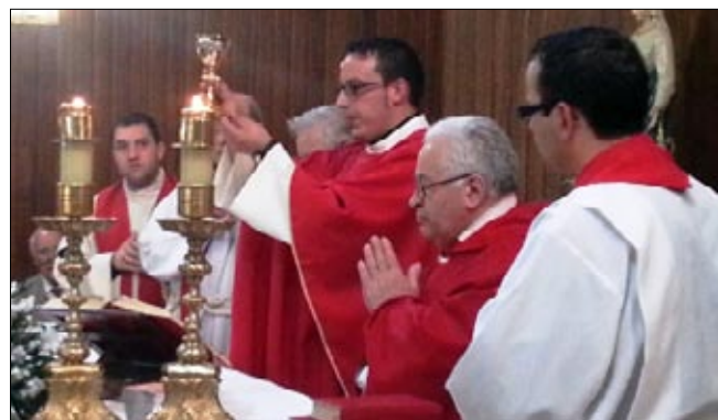
Unos días después, celebraba su primera Misa en la parroquia de Santa Teresita.