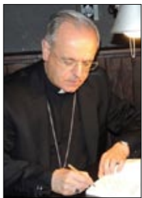
Monseñor Lemos Montanet Bispo de Ourense