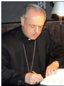
Monseñor Lemos Montanet Bispo de Ourense