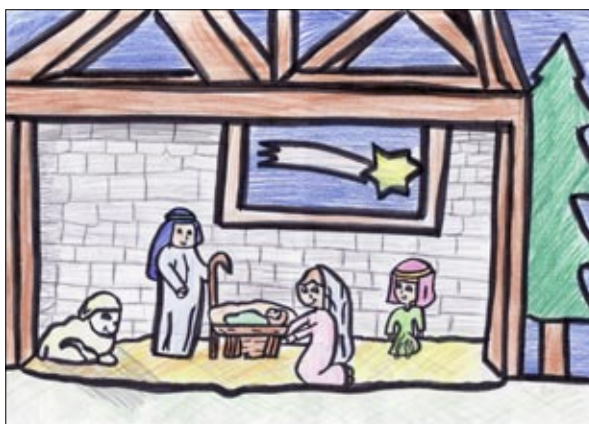
Finalista: Lucía, 10 años, (Vistahermosa)