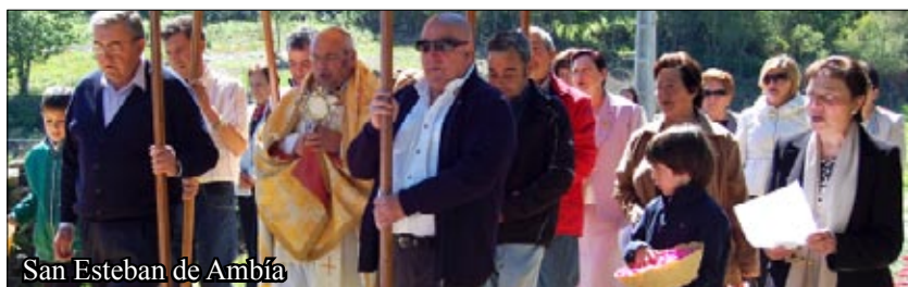
San Esteban de Ambía