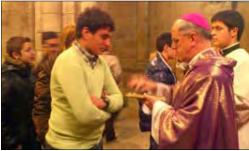
La Cuaresma es camino, la Pascua es la meta - Delegación de Liturgia

El día 13 de febrero, Miércoles de Ceniza, entramos en el tiempo de Cuaresma: la austeridad, el recogimiento, la oración, la caridad y la penitencia marcan el camino de preparación para la Pascua del Señor. Durante estos cuarenta días, hasta el Domingo de Ramos, con que comienza la Semana Santa, la Iglesia nos invita a la renovación, a vivir la gracia del Bautismo y esforzarnos en la tarea de la conversión.