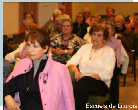
Escuela de Liturgia