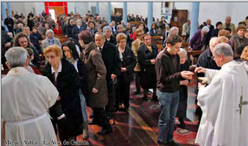
Miguel Villar / La Voz de Galicia

La parroquia de la Inmaculada celebraba su 50 aniversario en el mes de abril con una Eucaristía presidida por Monseñor Lemos y con la inauguración de una exposición de fotografías y dibujos de los niños de catequesis que se podrá visitar durante todo el mes de mayo, los domingos a partir de las 12:00 horas.