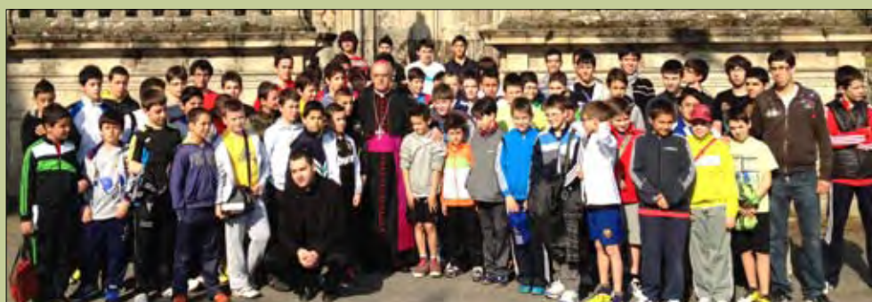
(Foto del Encuentro Vocacional en el Seminario Menor el pasado mes de abril)