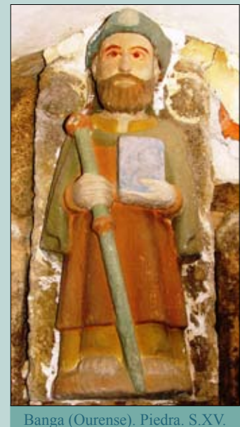
Banga (Ourense). Piedra. S.XV.