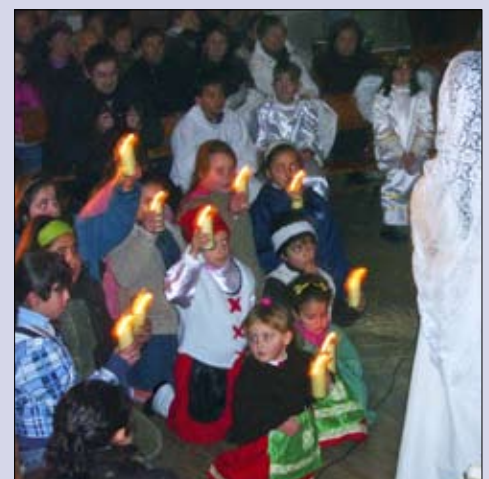
Representación teatral del Nacimiento del Señor en la parroquia de Bande

Los niños de los colegios de Sarreaus y Vilar de Barrio organizaron un concurso de postales de Navidad y Belenes.