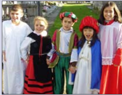
Belén viviente de los niños de la parroquia de Poulo.