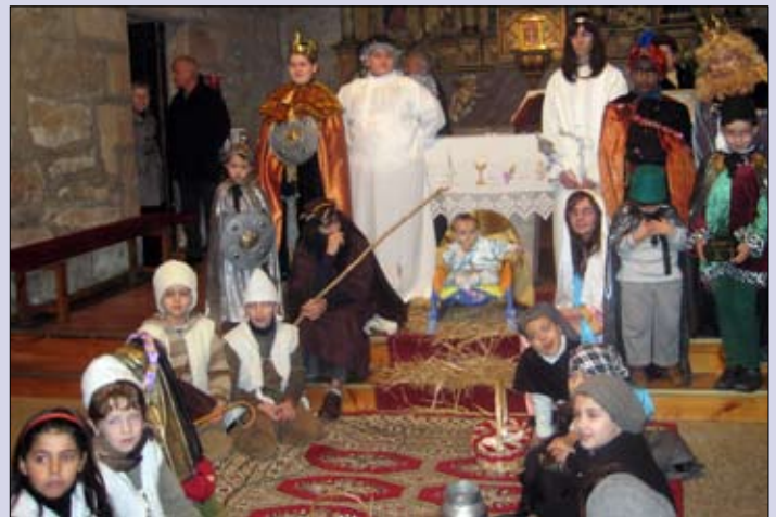
Belén viviente de la parroquia de Canedo