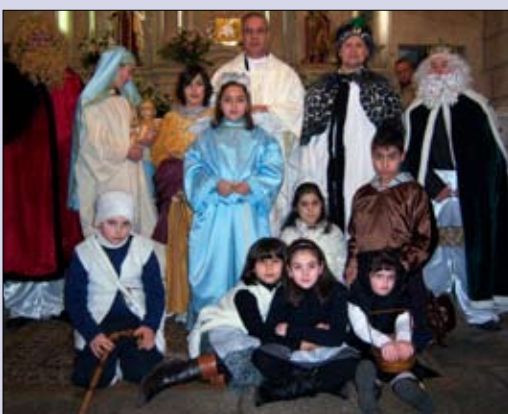
Belén viviente de la parroquia de Señorín

El belén instalado en Salesianos contaba con un sistema de iluminación que simulaba las diferentes horas del día.