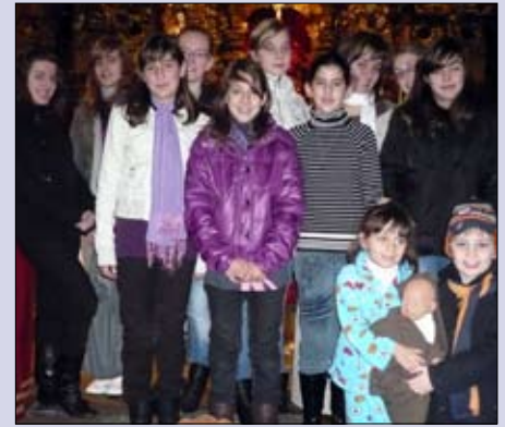
Escenificación navideña en Celanova