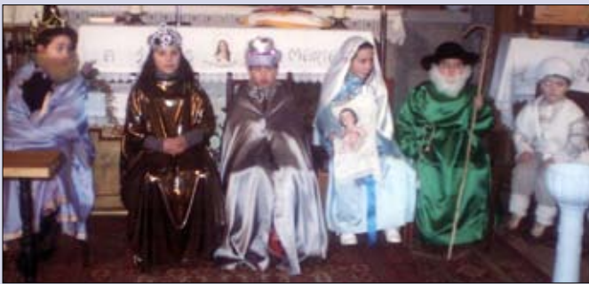
Nacimiento viviente de Monterrey