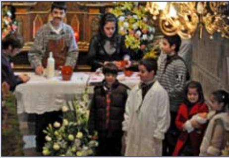
Escenificación de Navidad en Mourillós (Celanova).