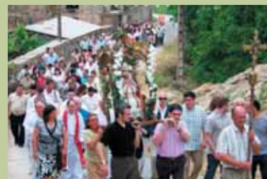
San Pedro en Mourillós