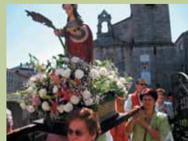
Santa Mariña en Xinzo