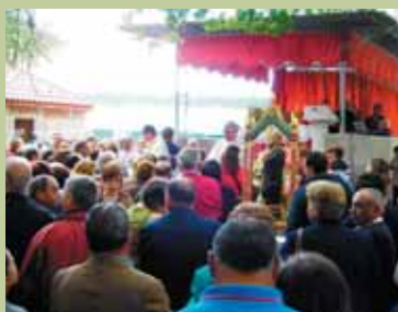
San Benito de O Maraño