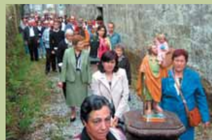
San Cristóbal de O Souto