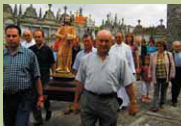
San Juan en Barrán

D URANTE los meses de julio y agosto numerosas parroquias de nuestra Diócesis celebran las fiestas en honor a su patrón; una oportunidad para compartir tiempo en familia y fortalecer los vínculos de la comunidad parroquial. Desde muchas zonas nos llegaron noticias de las fiestas patronales: