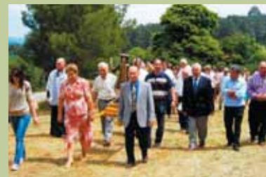
San Paio en Loeda