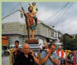
San Cristóbal en Cea