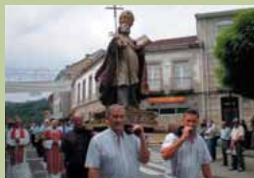
San Pedro en Leiro