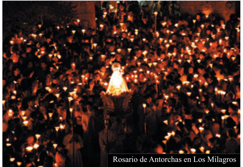
Rosario de Antorchas en Los Milagros

EN este mes de agosto, en que muchos pueblos celebran las fiestas de su patrón, comienzan también en la Diócesis de Ourense numerosas novenas en honor a la Virgen. Son muchas las advocaciones que congregan a miles de fieles en diferentes parroquias y santuarios.