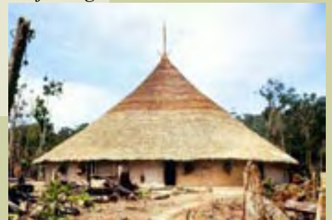
Churuata utilizada como Igrexa. Os Piaros do alto Orinoco chámanlle así a esta vivenda circular feita de palma e varas delgadas formando un gran paraugas.