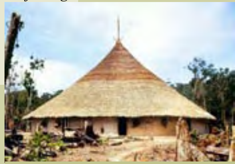
Churuata utilizada como Igrexa. Os Piaros do alto Orinoco chámanlle así a esta vivenda circular feita de palma e varas delgadas formando un gran paraugas.