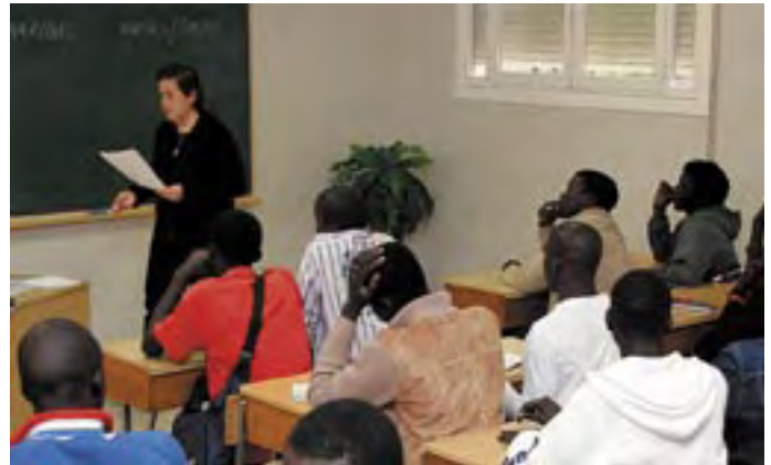
Curso de alfabetización para inmigrantes

se implican mutuamente y no pueden separarse una de la otra. Para la Iglesia, la caridad no es una especie de actividad asistencial que también se podría dejar a otros, sino que pertenece a su naturaleza y es manifestación irrenunciable de su propia esencia.” Carta Encíclica “Deus Caritas Est” del Papa Benedicto XVI.