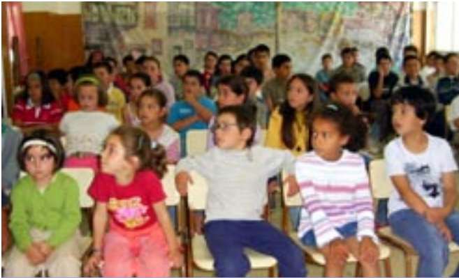
Alumnos de religión

A finales de enero, los profesores de Primaria y Secundaria volvían a reunirse en una nueva Jornada de Formación sobre Medios de Comunicación: cómo motivar en el aula .