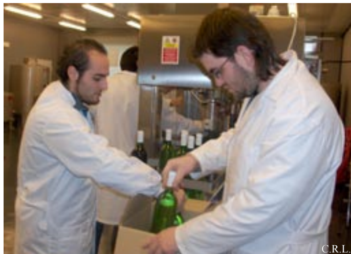
Alumnos del Centro de FP