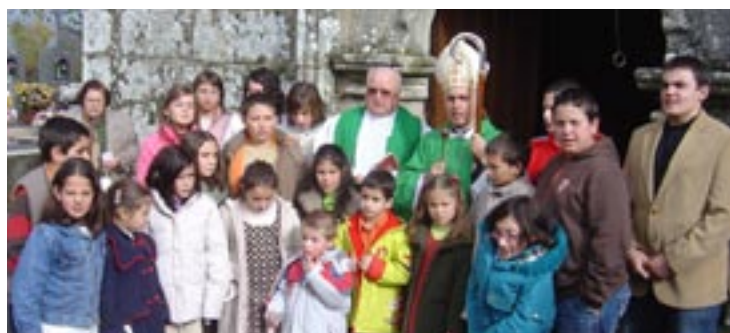
San Salvador de Sabucedo de Limia

E L domingo día 4 de febrero el Obispo de Ourense inicia la Visita Pastoral a las parroquias del Arciprestazgo de Ourense Norte con su presencia en San Miguel de Canedo y Santa Ana del Pino, mientras el domingo día 11 estará en La Purísima Concepción de Vilar de Astrés y San Pedro de Cudeiro. Los días 24 y 25 de febrero, sábado y domingo, la Visita Pastoral se desarrollará en Santa Teresita del Veintiuno. ■